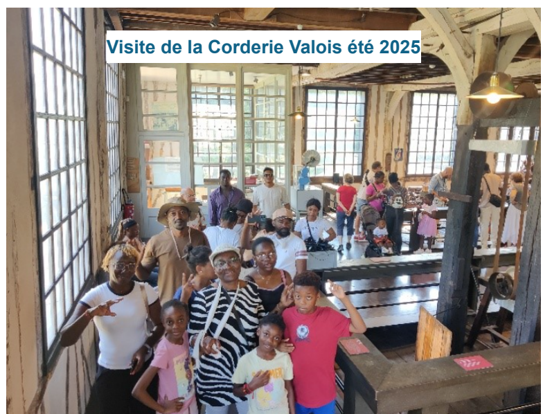
Visite de la Corderie Valois été 2025