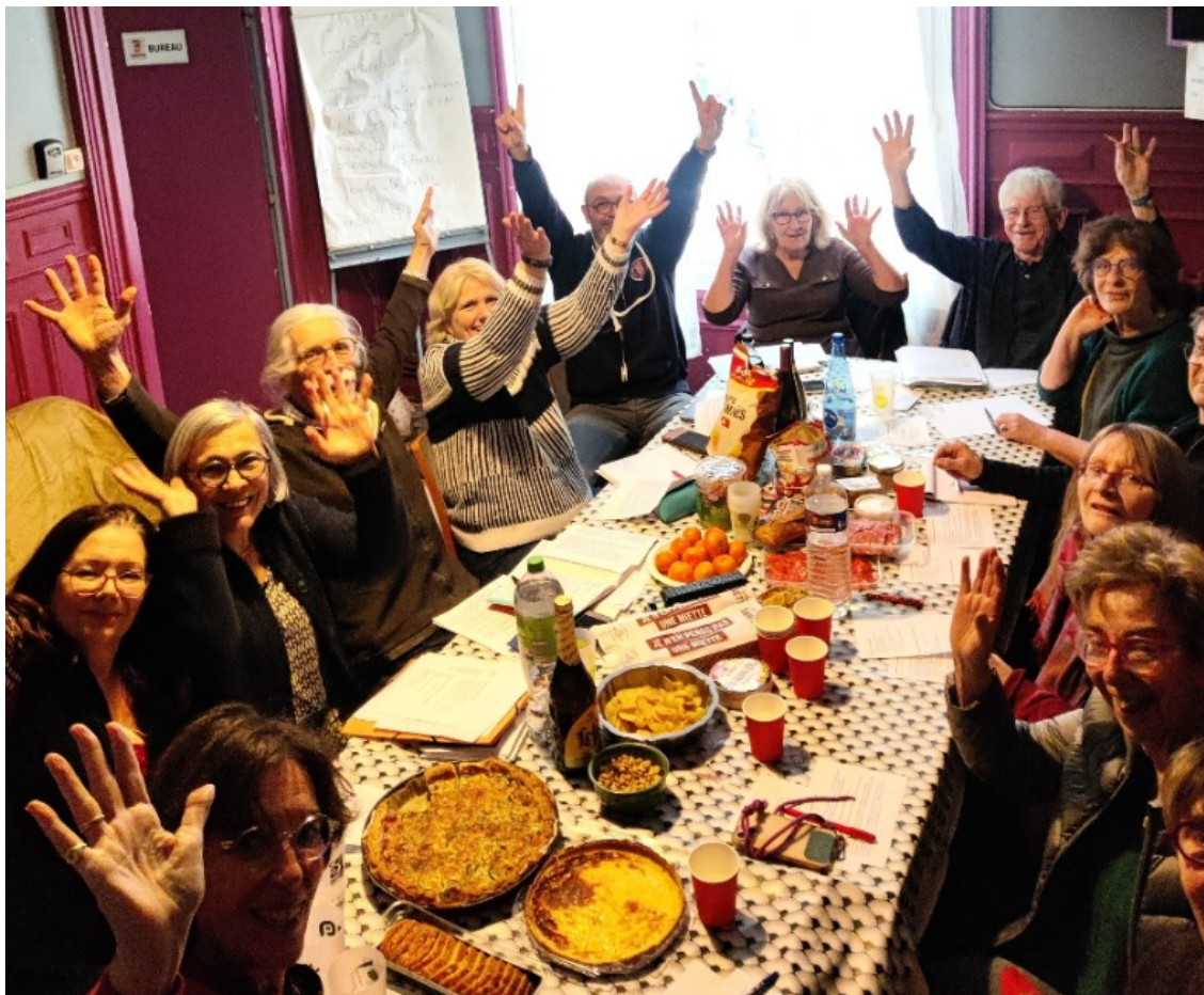
Le CA en plein travail