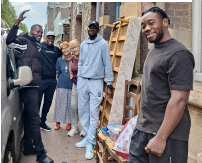
Nettoyage, rangement des maisons partagées, déménagements divers, voici l'entraide