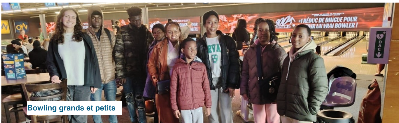
Bowling grands et petits