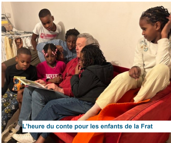
L'heure du conte pour les enfants de la Frat