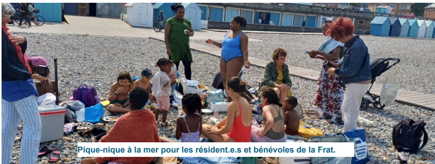
Pique-nique à la mer pour les résident.e.s et bénévoles de la Frat.