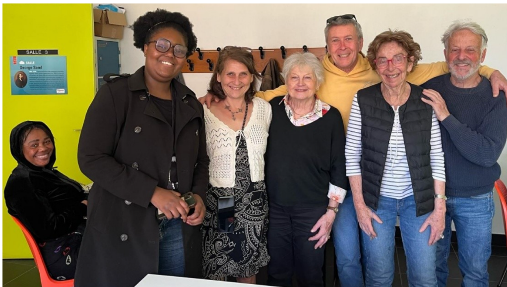
La permanence (presque au complet)

La plupart des personnes reçues viennent pour une demande d'hébergement. La part de femmes seules avec enfants augmente ainsi que celle des personnes sorties de CADA sans solution.