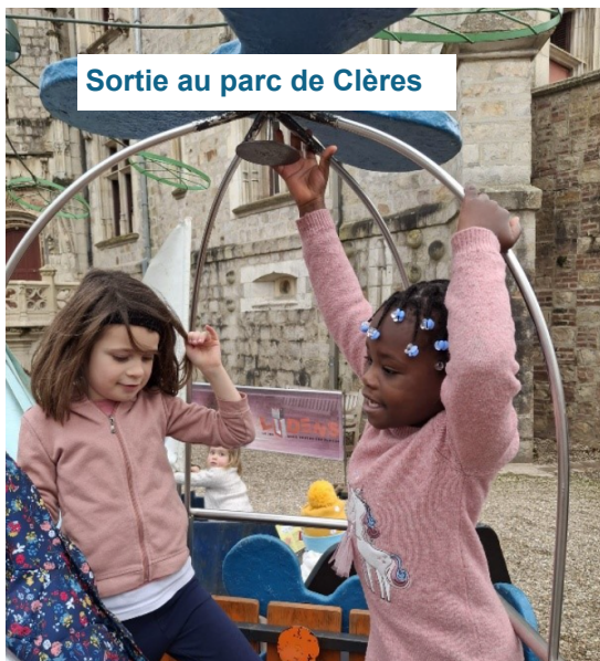
Sortie au parc de Clères