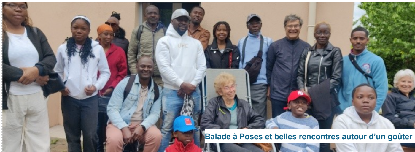
Balade à Poses et belles rencontres autour d'un goûter